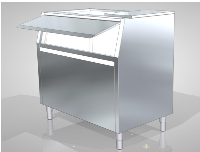
Рис. 2 Бункер с открытой дверцей

5.2 При заполнении бункера льдом (контролируется визуально) необходимо, не выключая льдогенератор, открыть дверцу бункера (рис. 2) и при помощи совка переложить лед в подготовленную емкость (не поставляется в комплекте).